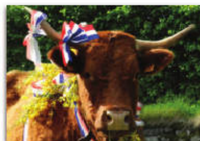
Participation aux fêtes traditionnelles