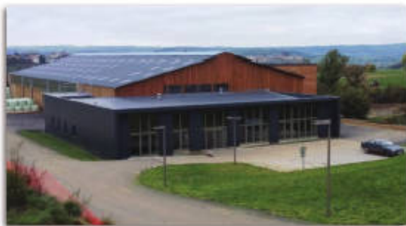
Nouveau bâtiment 2014

Le lycée agricole de Saint-Flour dispose d'une exploitation, support privilégié d'expérimentation et de travaux pratiques avec :