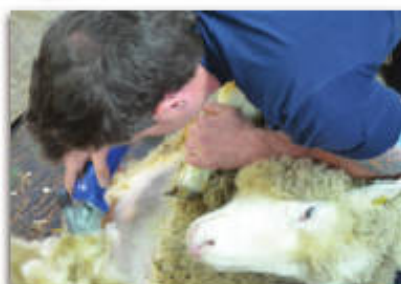
Travaux Pratiques : Zootechnie