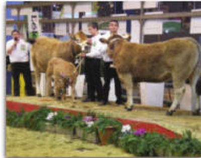
Production bovin viande