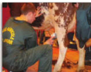
Organisation de concours