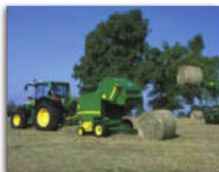
Utilisation du matériel