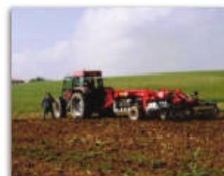
Culture de montagne