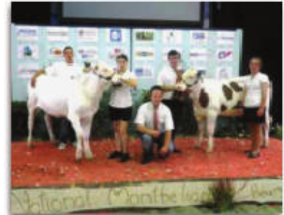
Production bovin lait