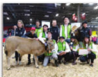
Participation au SIA de Paris