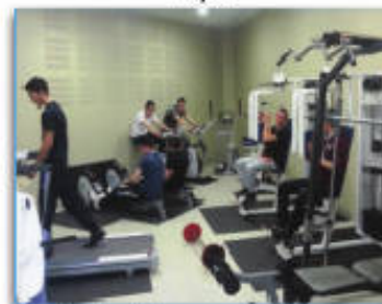
Salle de musculation

Le Lycée Louis Mallet propose dans le cadre de l'association sportive et de l'association des lycéens et des étudiants différentes activités périscolaires :