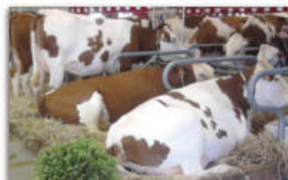
Production bovin lait