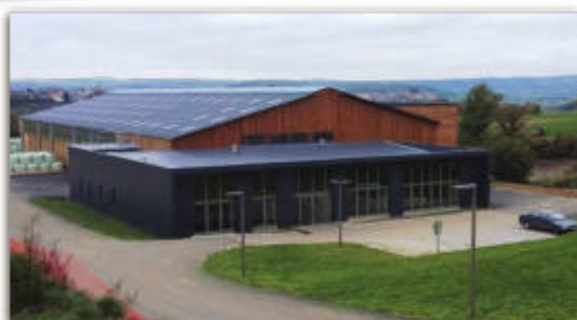
Nouveau bâtiment 2014

Le lycée agricole de Saint-Flour dispose d'une exploitation, support privilégié d'expérimentations et de travaux pratiques avec :